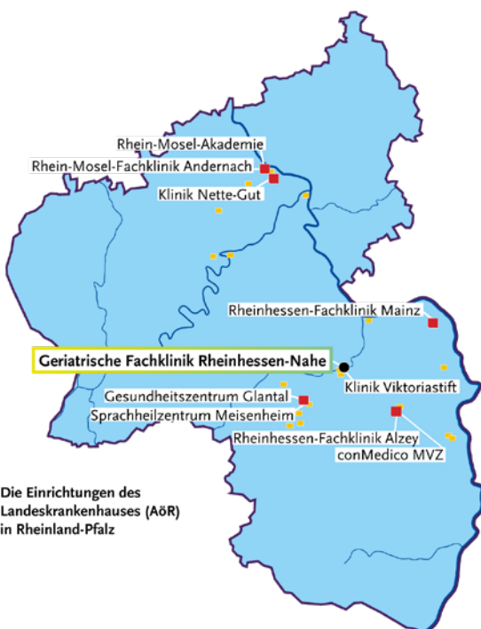
Die Einrichtungen des Landeskrankenhauses (AöR) in Rheinland-Pfalz

Das Landeskrankenhaus [AöR] ist der größte Krankenhausträger im psychiatrisch-psychotherapeutischen und neurologischen Bereich in Rheinland-Pfalz. Mit unserer langjährigen, intensiven Erfahrung in allen Facetten der Psychiatrie, Psychotherapie, Psychosomatik und Neurologie sowie in weiteren Bereichen des Gesundheits- und Sozialwesens bieten wir in allen unseren Einrichtungen eine qualitativ hochwertige und wirtschaftlich ausgewogene Versorgung an.